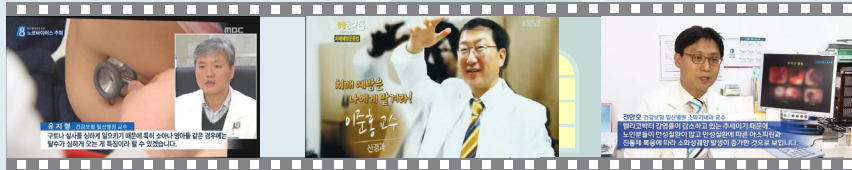
노로바이러스 소아청소년과 유지형 교수 11월 13일 SBS 뉴스